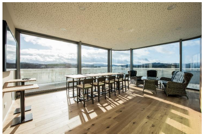
Tafel + Lounge